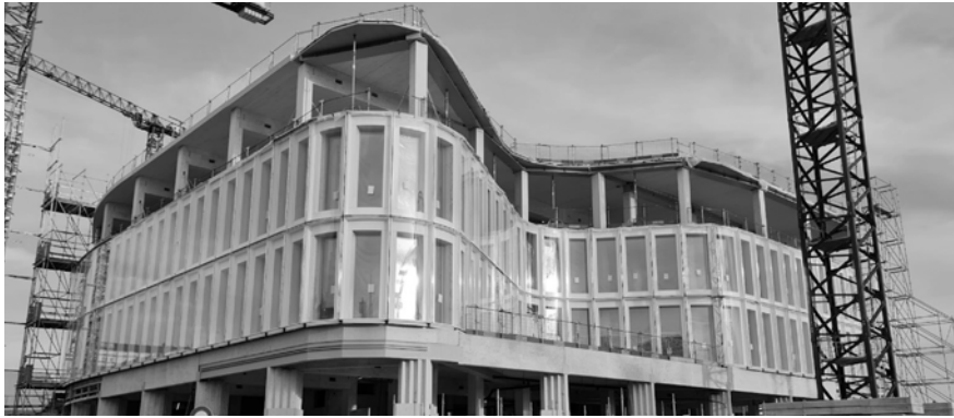
Figura 1. Edificio oficinas centrales Stora Enso Helsinki, Finlandia.