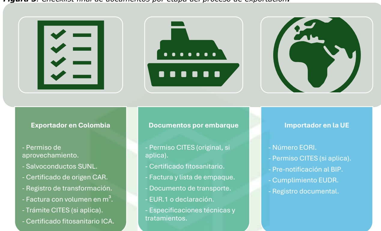
Figura 5. Checklist final de documentos por etapa del proceso de exportación.