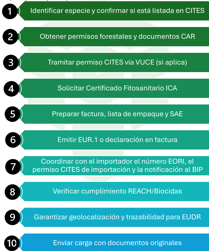
Figura 4. Paso a paso para exportar productos maderables desde Colombia.