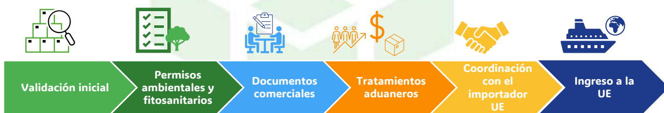
Figura 1. Ruta operativa de exportación de madera desde Colombia a la Unión Europea (UE)

Aquí se integran de manera didáctica los requisitos colombianos —como permisos forestales, certificaciones fitosanitarias, trámite CITES y controles aduaneros— junto con las exigencias europeas, incluidos los requisitos fitosanitarios (SPS), las regulaciones químicas (REACH y BPR), el mercado de la Comunidad Europea (CE), los controles de legalidad, las prohibiciones sobre madera ilegal, y el nuevo Reglamento de la UE 2023/1115 (EUDR) sobre productos libres de deforestación.